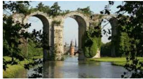
Aqueduc de Vauban

Visite du château de Madame de Maintenon, à Tourelles à environ 20 kms de Chartres (drapeau vert). Madame de Maintenon est la femme secrète de Louis XIV pendant 32 ans, car leur mariage a été secret. Enfin peut-on dire secret car tout le monde a fini par comprendre que c'est la femme de Louis XIV. Pourquoi ? Parce que si Madame de Maintenon était discrète pour leur mariage, Louis XIV l'était beaucoup moins. Par exemple quand un courtisan demandait car il a des doutes, si elle pouvait porter la tenue en hermine symbole de la royauté, Louis XIV avait répondu oui. La messe était dite ! En plus du château, au fond du parc, il y a un viaduc qui devait amener les eaux de l'Eure au château de Versailles, une vraie folie de Louis XIV car il voulait amener les eaux par le chemin haut du viaduc pour la grandeur de la France, il n'a jamais été achevé malgré les 20.000 soldats qui ont travaillé pendant 5 ans.