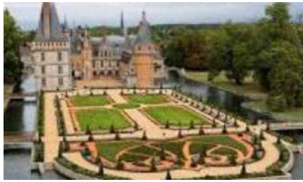
Château de Maintenon