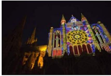
Nuit à Chartres