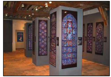
Centre international du Vitrail